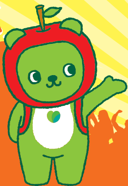
長野県PRキャラクター 「アルクマ」 ©長野県アルクマ