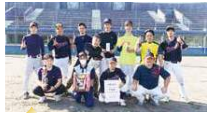
準優勝 広丘青年商工会