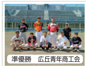
準優勝 広丘青年商工会