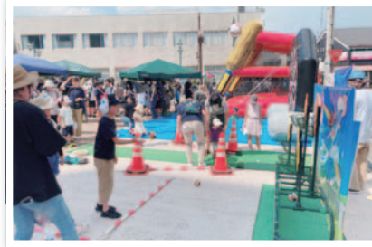
会場は多くの子 ども達で賑わい ました

午後5時から、17連、約880人が玄蕃おどりを踊りながら大門商店街を練り歩きました。4年ぶりに大門商店街に夏の賑わいが戻ってきました。