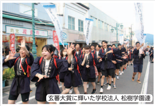
玄蕃大賞に輝いた学校法人 松樹学園連

7月29日(土)、4年ぶりの通常開催となる「第48回塩尻玄蕃まつり」が開催されました。